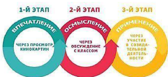
Рис. 1. Этапы проведения киноуроков

3) важный результат киноурока – возникшая у школьников потребность подражания героям, которая реализуется в ходе проведения социальной практики , – общественно полезного дела, инициированного детьми и позволяющего проявить рассматриваемое качество личности на практике.